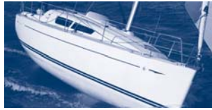
Sun Odyssey 30i Performance