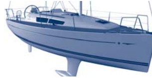
Sun Odyssey 33i