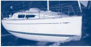
Sun Odyssey 30i